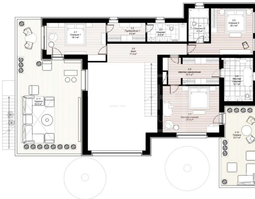
План расстановки мебели 2 этаж