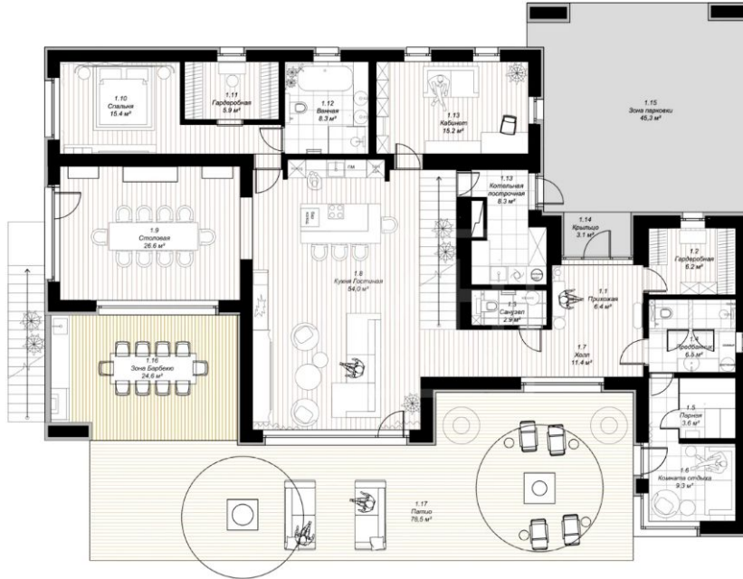
План расстановки мебели 1 этаж